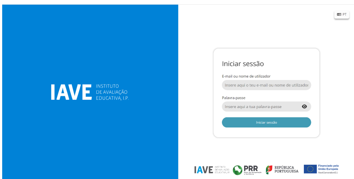
Figura 1 – Acesso à Plataforma de Realização de Provas do IAVE

( Obs.: Para as escolas que optaram pelo offline em rede ou standalone, os procedimentos para acederm à Plataforma de Realização de Provas do EduQA são os constantes no Manual Offline, publicado na Área Escolas do JNE);