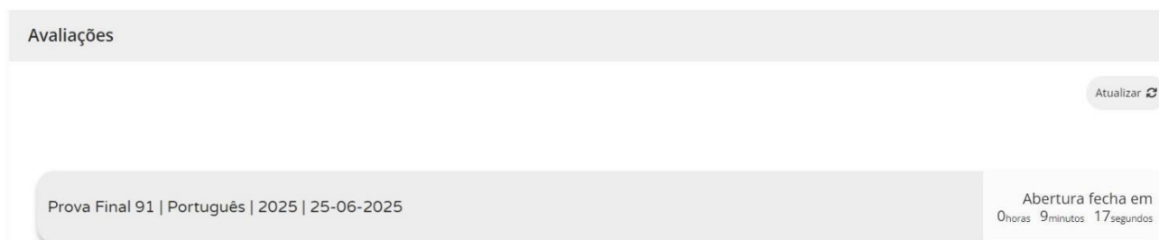
Figura 2 – Acesso à prova a realizar

11.12. Para aceder à prova, o aluno tem de clicar em cima da zona cinzenta onde se encontra escrito o nome da prova.